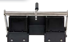
4 in x 4 in x 4 in SmartDie II

Возможность нанесения одинарных (5-30см), пунктирных, а также двойных линий с помощью специального модуля «двойная линия». С помощью трафаретов возможно нанесение надписей, предупреждающих и запрещающих знаков.